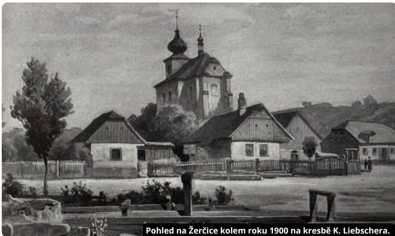
Pohled na Žerčice kolem roku 1900 na kresbě K. Liebschera.