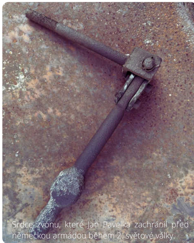
Srdce zvonu, které Jan Pavelka zachránil před německou armádou během 2. světové války.