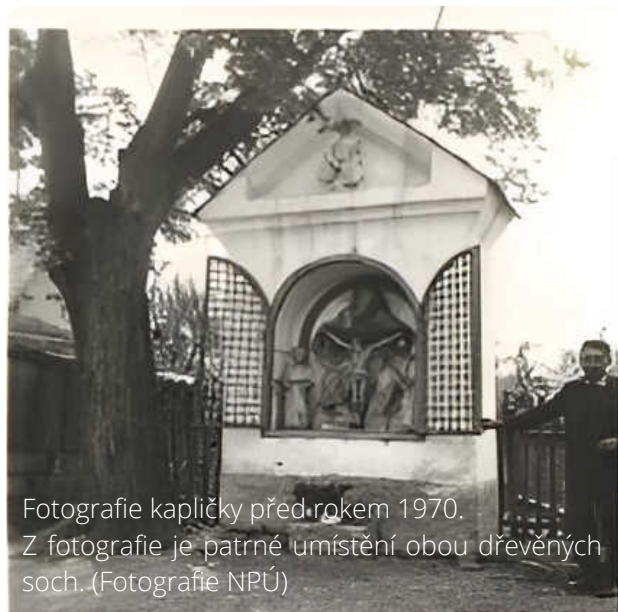
Fotografie kapličky před rokem 1970. Z fotografie je patrné umístění obou dřevěných soch.