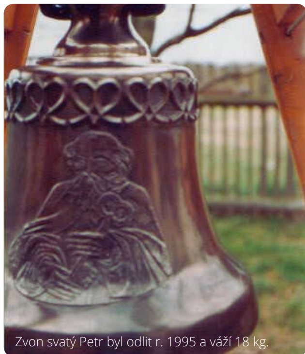
Zvon svatý Petr byl odlit r. 1995 a váží 18 kg.

Abychom ukrátili dlouhé čekání na nové objevy z archivů a starých knih a na nové nálezy archeologické, pokusíme se Vám přinášet alespoň drobné příspěvky a zajímavosti z blízkého okolí, které prohloubí znalost místa kde žijete.