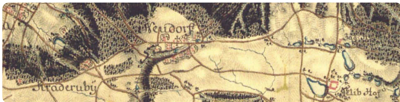
Výřez z prvního vojenského mapování, ze kterého je patrné existence kapličky na Nové Telibi – Neudorf.

O původu sochy andělíčka v průčelí se žádné známé prameny nezmiňují. Kromě hlavní sochy Nejsvětější Trojice byly ve výklenku umístěny ještě dvě drobné lidově pojaté polychromované dřevořezby světců. Vlevo stála, ještě v roce 1970, kdy byl pořízen záznam Národního památkového úřadu, soška neznámého světce, snad sv. Petra. Soška na pravé straně byla již v této době ztracena. Stejný výzkum předpokládá dobu vzniku kapličky do 16. století. Bez bližšího průzkumu však není možné přesně vznik kapličky datovat. Kaplička je zachycena na prvním vojenském mapování z let (1764-1768 a 1780-1783), s jistotou tedy můžeme říci, že byla vybudována někdy před tímto datem.