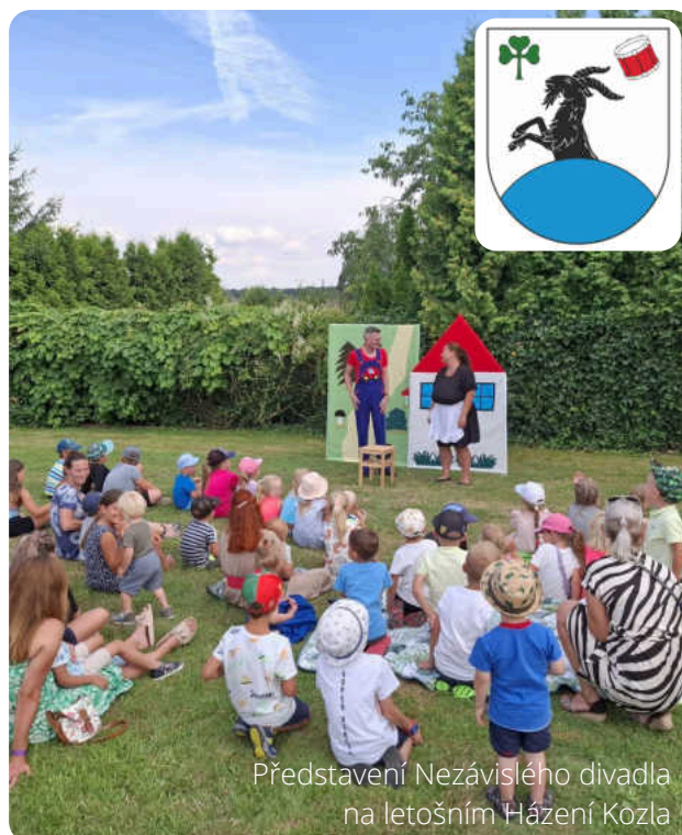
Představení Nezávislého divadla na letošním Házení Kozla

6) Z důvodu že finanční hospodaření naší obce skončilo za rok 2023 výrazným přebytkem, tak jsem seznámil zastupitele s návrhem na zřízení dalšího termínovaného vkladu u Komerční banky. Tento vklad byl jednomyslně schválen a to ve výši 3 mil. Kč. Již je to druhý náš termínovaný vklad u Komerční banky a důvody jeho zřízení jsou stejné – zhodnotit prozatím nevyužité volné finance