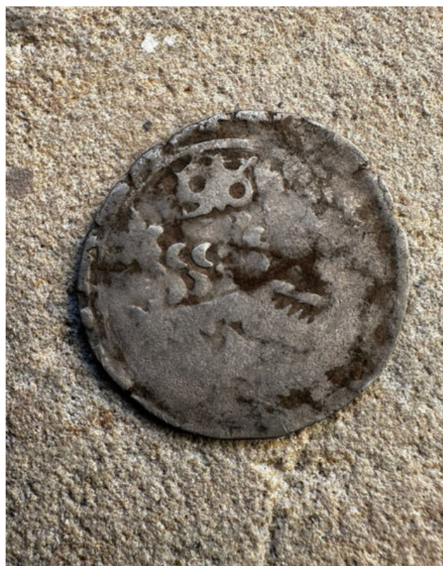
Pražský groš Václava IV. (1378-1419) nalezený v jedné z úvozových cest pod Novou Telibí. Líc mince nese královskou korunu a rub korunovaného dvouocasého lva.