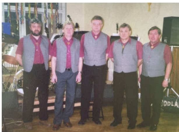
Jeden z "dress codů" skupiny Bodlák.