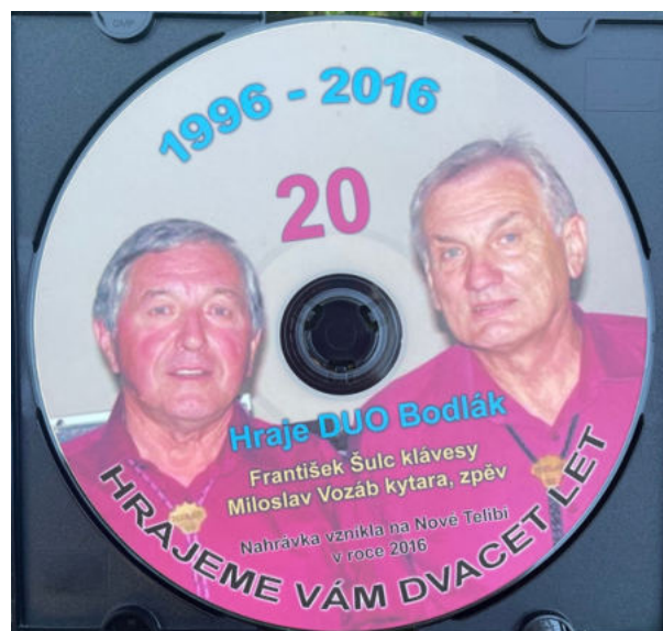
K 20. letému výročí nahrál BODLÁK CD - nahrávka vznikla na Nové Telibě v roce 2016.

Je to za náma, ale i sem tam, když si dnes na zkušebně zahrajeme, tak se nám třeba nechce, ale když to pustíme a hezky nám to ladí, tak si zazpíváme a řvem jak paviáni a máme z toho radost.