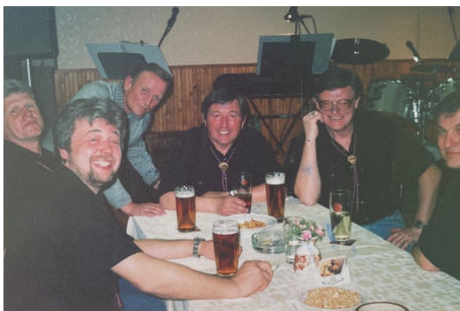
Oslava narozenin v roce 2003.