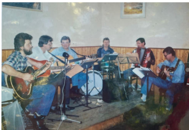
Velká zkouška na sále Nová Telib r. 1997.