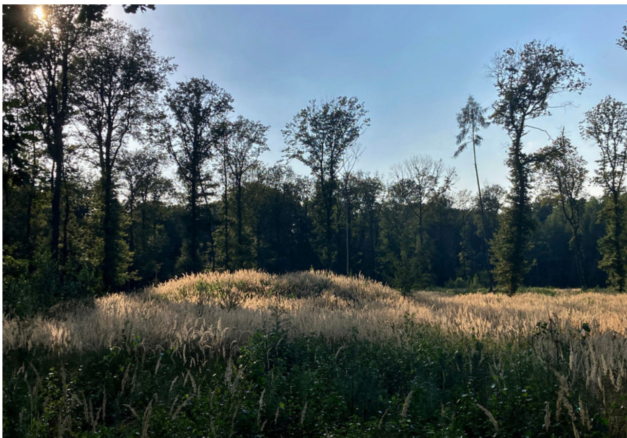
Foto 1 - Jedna ze čtyř mohyl nacházející se v oplocence brzy zaroste novým lesem.

V krajině snadno identifikovatelné vyvýšené kopečky se často, a to i nedlouho po svém vzniku, stávaly cílem zlodějů. Velká většina mohyl, nejen v naší lokalitě, tak nese stopy zásahů do jejich těles. Nejčastěji z vrchu, nejpřímější cestou do pohřební komory a uloženým milodarům. Stejně zásahy jsou tak dokumentovány i v naší lokalitě. Mohyly na Holi jsou, i díky svým rozměrům, pravděpodobně vykradené. Úpatí zkoumané mohyly bylo po svém obvodu obloženo kameny a nejspíše na jejím vršku se nalézala kamenná stéla objevená při archeologickém průzkumu. Mohylová pohřebiště neskrývají hroby pouze pod viditelnými náspy. Z celé řady prozkoumaných lokalit, je zřejmé, že se běžné hroby nacházejí také v jejich bezprostřední blízkosti. Rovněž jejich velikost a na první pohled jasný účel předpokládá zvýšenou pozornost a aktivitu tehdejších lidí v daném prostoru. Mohylové pohřebiště, ani jeho nejbližší okolí však doposud neposkytlo žádné další archeologické nálezy. Lokalita náleží do střední doby bronzové, kdy krajinu obýval lid mohylové kultury. Místním okolím rovněž panují zvěsti, že se v jedné z mohyl, po čase druhé světové války, ukrýval ruský partyzán.