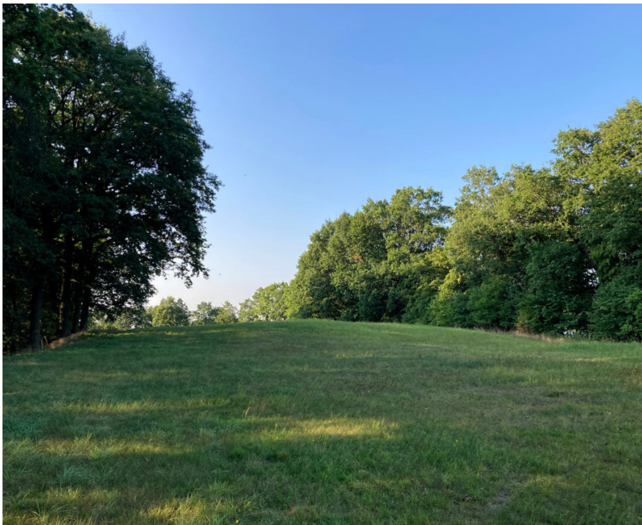
Foto 2 - Viditelná část erodovaného valu.

Z příkladu, těchto dvou lokalit je zřejmé, že i na první pohled jasné nemovité památky, jejichž stavba si dozajista vyžádala nemalé úsilí velkého množství tehdejšího obyvatelstva, mohou nést jejich pramalou hmatatelnou stopu. Ne vždy, nám chtějí archeologické lokality vydat svá tajemství lacino.