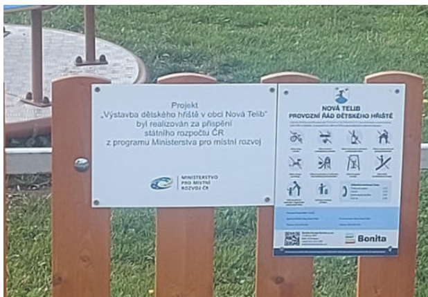
Nová Telib obdržela dotaci na dětské hřiště