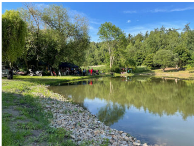
Slavnostní otevření rybníku Žid